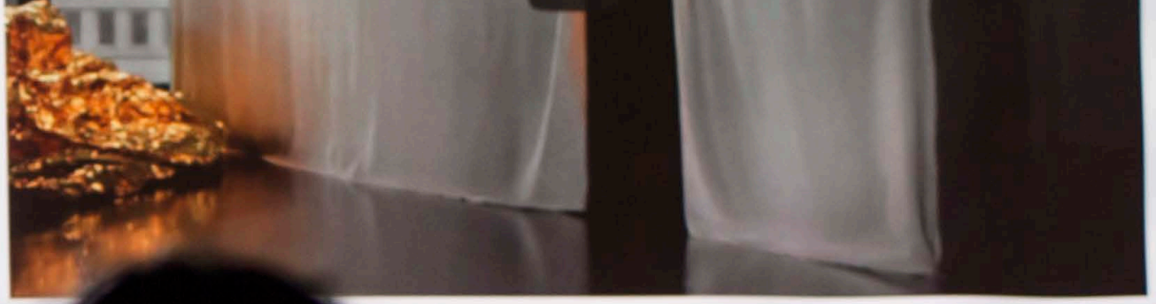
Showed at the National Museum, Stockholm, 2015, Przemiany Festival, Warsaw, Poland, 2017

Sound Productions Soundtracks About/Contact